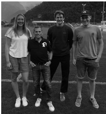
Neue Vorstandsmitglieder, v.l.n.r.: