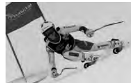
Abbildung 18: Delia Durrer

38 Renneinsätze in den Disziplinen DH, SG, GS und AC; 2x Sieg FIS-GS; 3x Gold an den Schweizermeisterschaften in Zinal in Abfahrt, Super G und Alpine Kombination