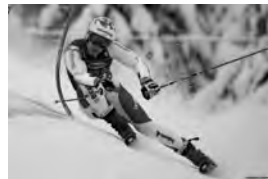
Abbildung 10: Marco Odermatt

27 Renneinsätze, 2. Rang Gesamtweltcup, 2. Rang GS-Weltcup, 2. Rang Super G - Weltcup, 2x WC-Siege Santa Caterina (GS) / Saalbach (SG), 9x Podest Weltcup in GS und SG, 4. Rang an Weltmeisterschaften in Cortina in der Abfahrt