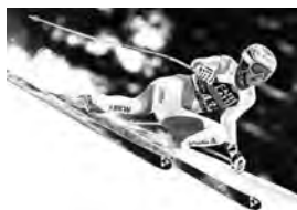
Abbildung 11: Nathalie Gröbli

Nathalie Gröbli (Fischer) keine Renneinsätze 2020/2021, Reha im Gange, freies Skifahren nach schwerer Knieverletzung (Sturz Weltcup-Abfahrt Garmisch-Partenkirchen), Trainingsaufnahme mit Team für Saison 2021/22 im Gange