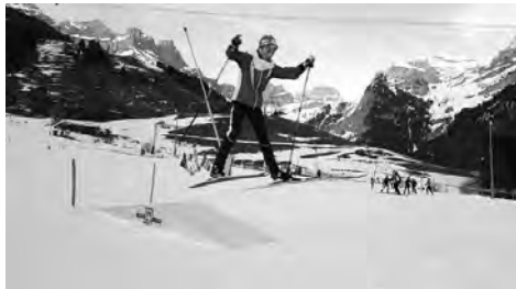
Abbildung 8: Sprungtechnik beim Langlauf-Cross, welcher dieses Jahr leider dem Corona-Virus zum Opfer gefallen ist