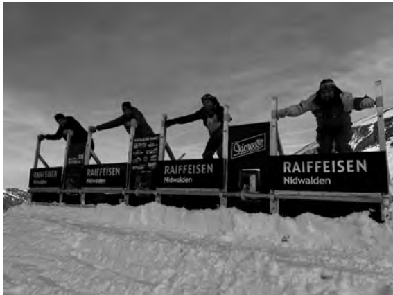
Abbildung 1: Start Gate für Skicross mit den Verantwortlichen

Eine Interessengruppe aus verschiedenen Skiclubs und dem NSV ermöglichte die Anschaffung eines Startgates für das Skicross-Training. Das Startgate wurde kurz vor Weihnachten in Zusammenarbeit mit der BBE im Gebiet Chälen montiert und den Vereinen und interessierten Skicrossern zu Verfügung gestellt. Der NSV sieht in dieser noch jungen Alpindisziplin ein grosses Potential für die Jugendförderung.