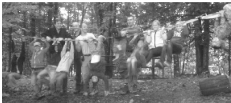
Erste Wanderung auf den Bürgenstock